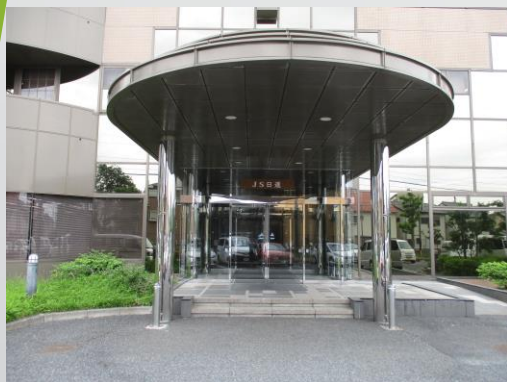
メイン エントランス