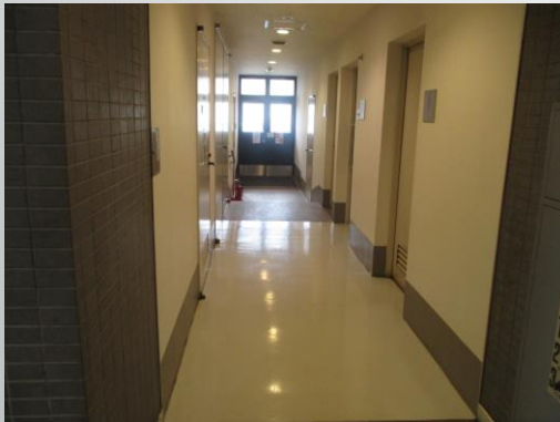
サブ エントランス