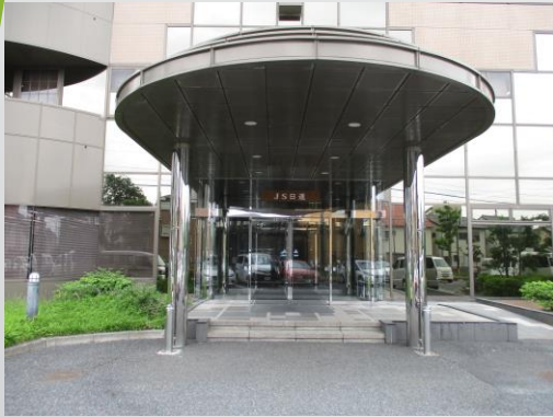
メイン エントランス